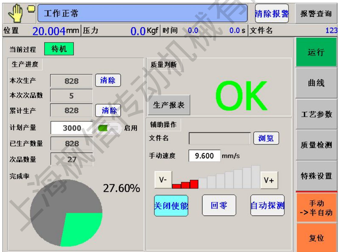
图 5-1 主页面