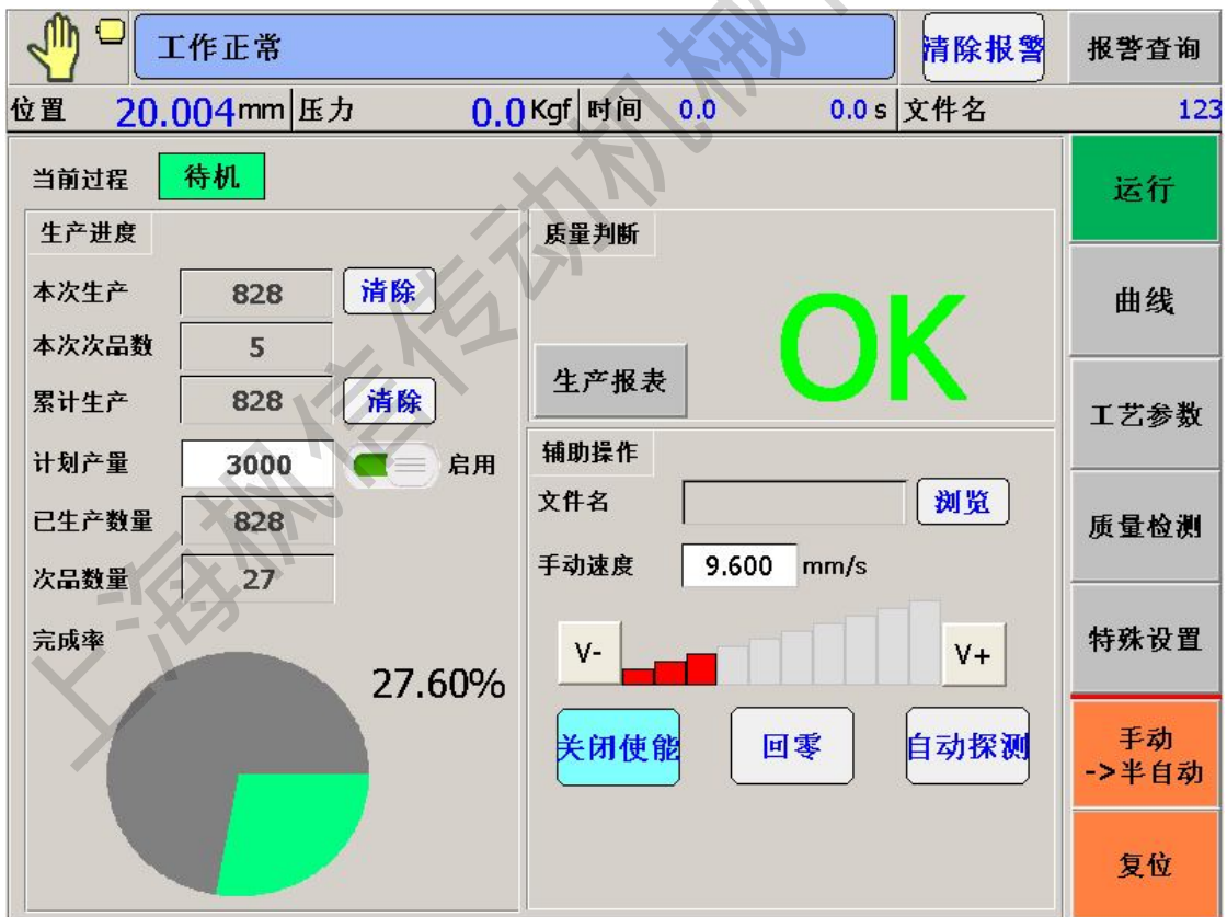
图 5-1 主页面