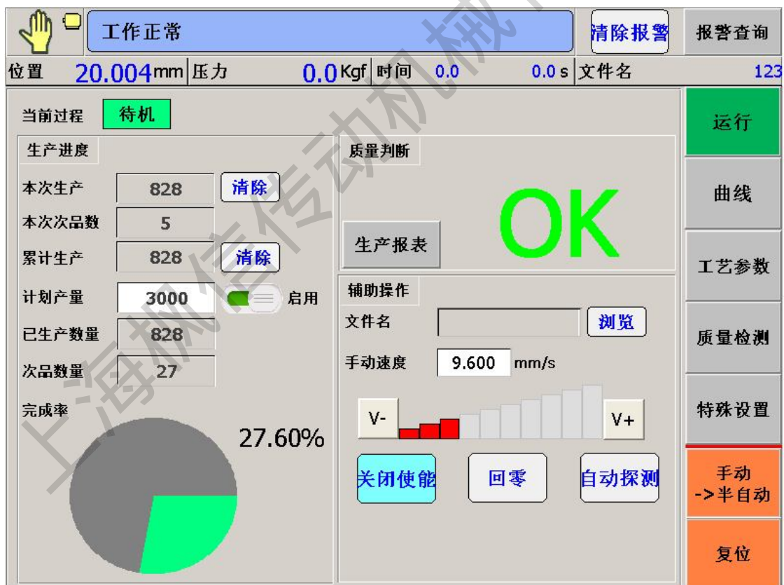
图 5-1 主页面