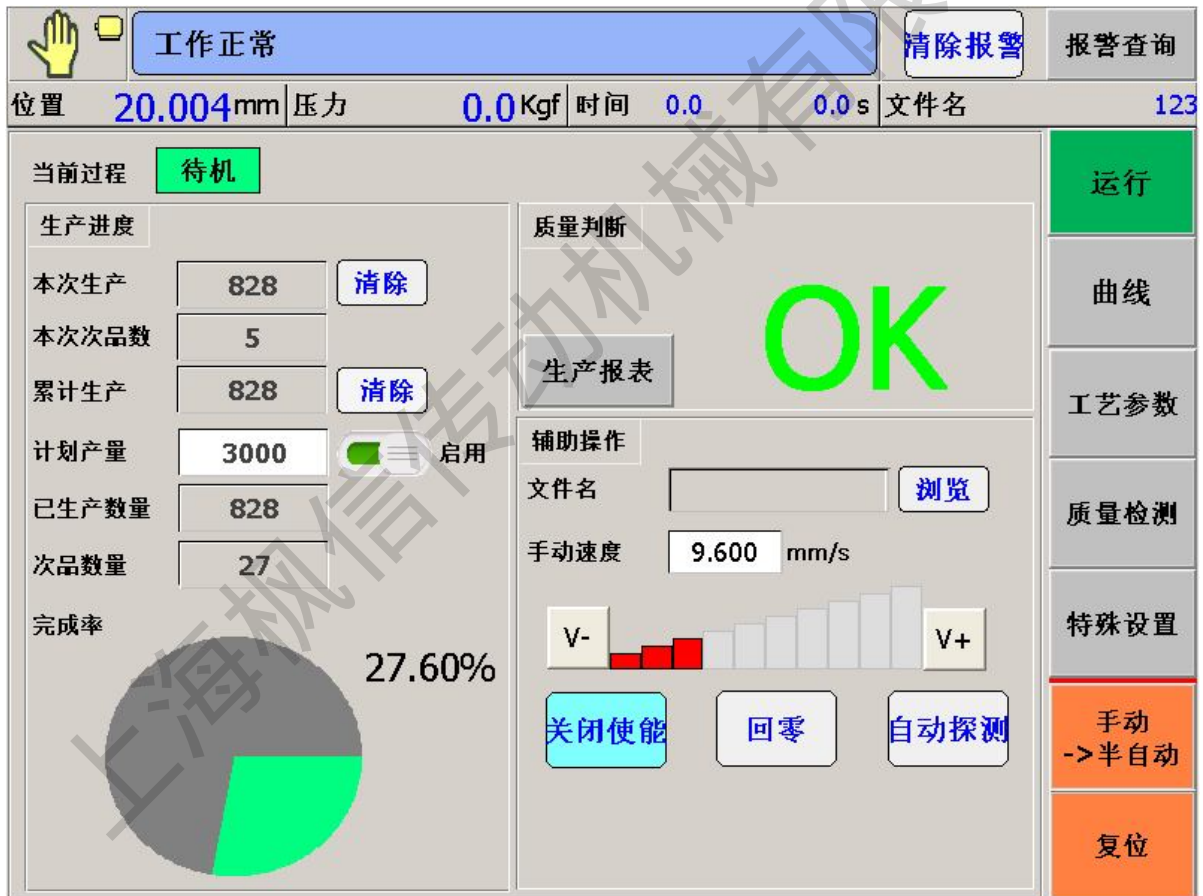
图 5-1 主页面